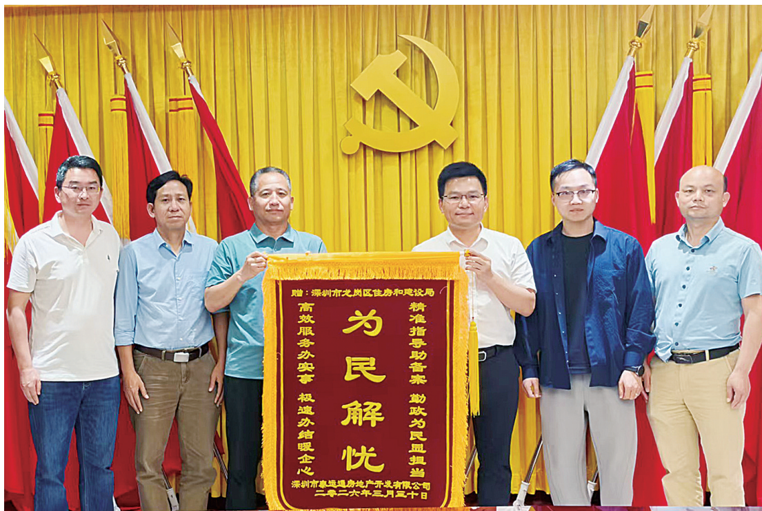
赠送锦旗现场。龙岗融媒记者 罗诗琴 摄

高效服务的背后，是制度创新的持续赋能。在服务平湖跨境电商产业园项目时，区住建局将过往经验提炼为可复制的标准化流程，创新推出“一码通办”服务——通过二维码集成定制化办事指南，将所有申报材料清单化、指引化、透明化，企