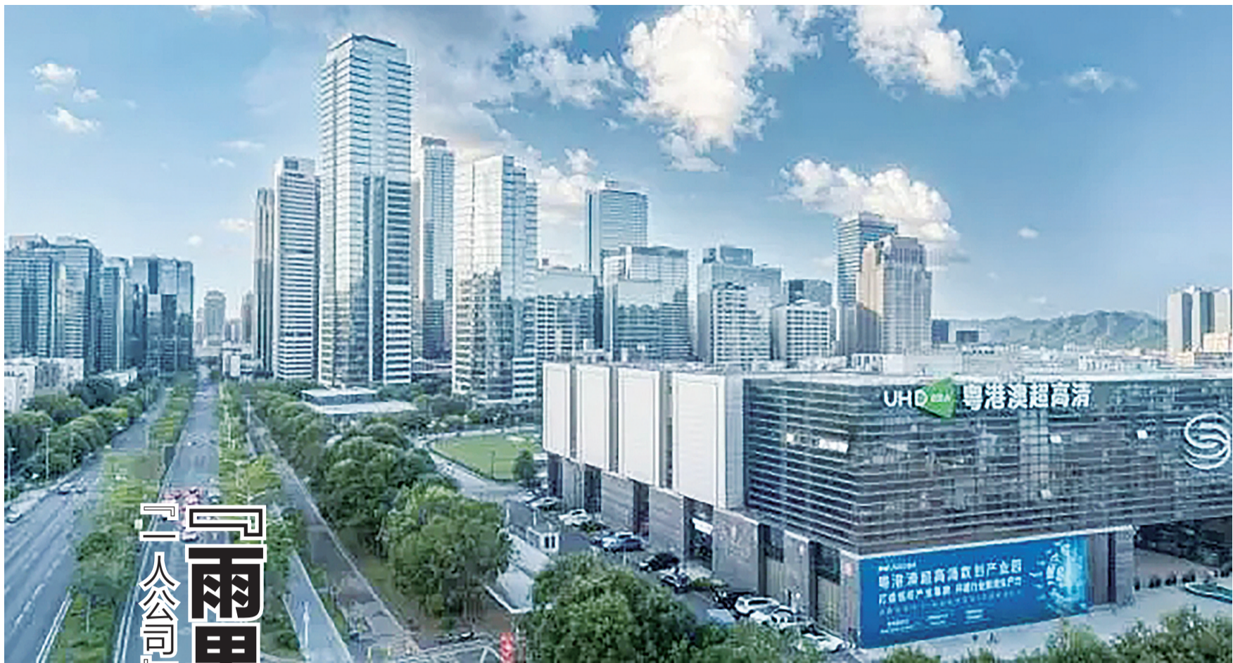
龙岗区超高清 OPC 社区所在的粤港澳超高清数创产业园。